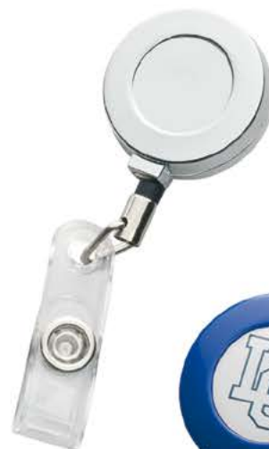
AM709 28 mm metal