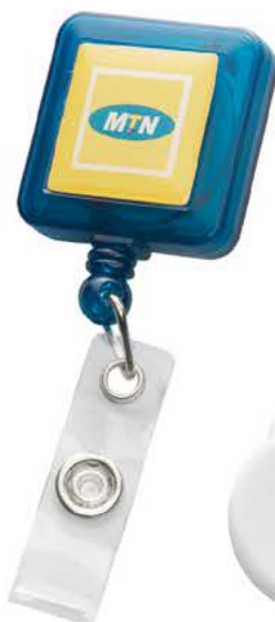
AM703 32 X 32 mm