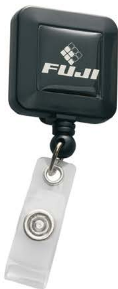
AM701 32 X 32 mm

Uit voorraad leverbaar. Available from stock