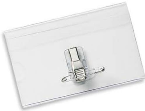
5590 55 x 90 mm