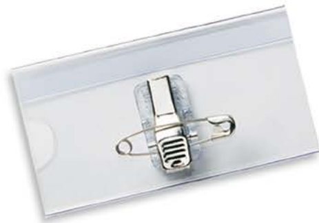
4075 40 x 75 mm